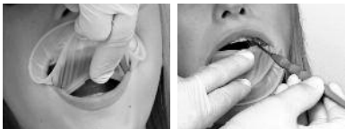
Фото 5: Окончательное расположение за верхней и нижней губой.

Если в отдельных случаях при полном закрытии рта интраоральное кольцо начинает выскльзывать из области нижней губы, чаще всего достаточно просто поместить глубже интраоральное кольцо. В любом случае, можно воспользоваться соответственно другим размером.