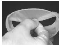
Фото 2: правильное удерживание интраорального кольца между большим и средним пальцем. Интраоральное кольцо при этом слегка сжимается.