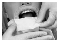
Фото 6: извлечение OptraGate ExtraSoft