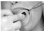
Фото 4: интраоральное кольцо позиционировано в преддверии полости рта.