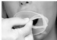
Фото 3: более толстое интраоральное кольцо задвигается между зубным рядом и углом рта.