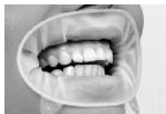
Фото 1: Надетый OptraGate ExtraSoft с крыльшками, направленными вниз. Оклюзия не нарушена.

Эластичный материал OptraGate ExtraSoft натягивается между двумя пальцами. Более толстое кольцо надевается при работе с пациентом интраорально в области переходной складки, в то время, как более тонкое кольцо с двумя крыльшками находится вне ротовой полости. Натянутая между пальцами эластичная часть может удерживать губы пациента и вытесняет кольца благодаря силе, создающемуся в резине (см. фото 1).